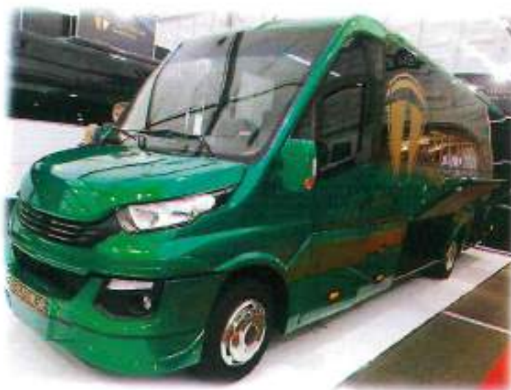
3 nuotrauka. 28 sėd. vietų Iveco markės autobusas