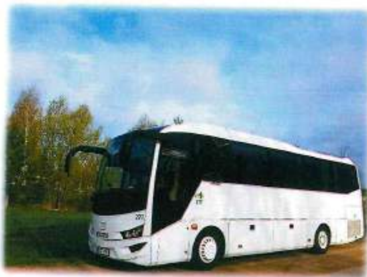
2 nuotrauka. Isuzu Visigo, 41 sėd. vietų markės autobusas

Vykdam 2016-2018 m. riedmenų atnaujinimo investicinio projekto nuostatas, Bendrovė per 2018 m. įgijo 14 naujų autobusų (per 2017 m. – 4-is autobusus). Sausio mėnesį įsigyti 5 (penki) autobusai: 1 Iveco 2 Isuzu Visigo ir 3 Temsa Prestij markės autobusai. Vasario mėnesį įgyti 3 (trys) autobusai: 2 Temsa Prestij, ir 1 Iveco markės autobusai. Rugspjūčio mėnesį įgyti 3 (trys), rugsėjo mėnesio – 2 (du) Temsa Prestij autobusai. Šie autobusai skirti tiek miesto, tiek priemiesčio, tiek tolimojo susisiekimo keleivių vežimams.