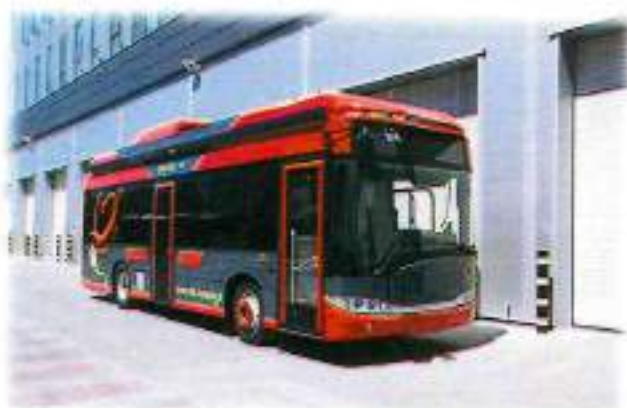
5 nuotrauka. Elektrobuses pavyzdys.

Su elektrobuses, kuriuos Bendrovė įsigys, planuojama maršrutus tankinti kas 20–25 minučių. Per tuos visus taškus mieste, kurie yra numatyti „Darnaus judumo“ plane. Taip pat numatyta įrengti išmanias elektronines informacines lentas, kuriose keleiviai matys, po kiek laiko atvažiuos kitas autobusas.