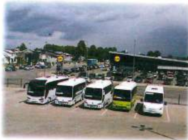
1 nuotrauka. Nauji Temsa Prestij, 26 sėdimų vietų autobusai

Bendrovė daug dėmesio skiria autobusų parko riedmenų atnaujinimui ir modernizavimui. Sėkmingiausios 2018 m. priemonės – strateginio ir investicinio riedmenų atnaujinimo plano, parengto 2016 metais, tęsimas.